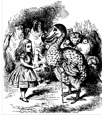
Alicia nada con el señor Ratón rumbo a una asamblea con un dodo y otros animales.

Entonces, ¿qué es Alicia sino un juego? De naipes en la primera parte y de ajedrez en la segunda. Pero, por encima de todo, es un juego de palabras, una gigantesca, y a veces pesada broma que Carroll le juega a la lengua inglesa. Si una lengua no es más que un juego social con unas reglas arbitrarias que se establecen por convenio, entonces lo que autor hizo fue alterar estas reglas, cambiar el significado convencional de las palabras y darles un nuevo sentido para que todo el mundo pudiera reírse.