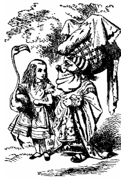
Alicia junto al Caballero Blanco. A la derecha, Alicia con la Duquesa tras la partida de croquet.

Como ya dijimos, en la primera parte el personaje de la Duquesa representa a la madre de la reina Victoria. Del mismo modo, la propia Victoria en A través del Espejo y lo que Alicia encontró allí es representada por la Reina Blanca. ¿Pero qué sabemos de las relaciones entre el matemático de Oxford y su ilustre majestad? Poca cosa. Sabemos que cuando publicó el cuento de Alicia, la reina se deleitó con su lectura y le envió una nota diciéndole que “no dejara de mandarle su próxima obra”. Cuentan las malas lenguas que el matemático así lo hizo... isólo que la próxima obra era Tratado elemental sobre determinantes!