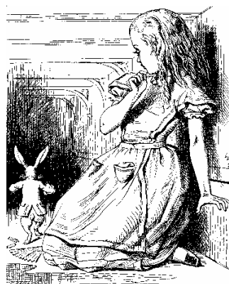
A lo largo de la historia la protagonista cambia varias veces de tamaño.

Otros patrones importantes de las Matemáticas son los patrones espaciales, es decir, las medidas. En el País de las Maravillas, a diferencia del nuestro, apenas se utiliza la medida. Al hablar con la Oruga, la protagonista demanda que su estatura reducida le parece ridícula. Al ofrecerle el insecto un trozo de seta que la hace crecer en tamaño queda probado que él está enterado de su propia altura y de la relación que mantiene con su alrededor, es decir, aunque no habla explícitamente en términos de tamaños y de unidades, sí conoce la diversidad de escalas. Si la Oruga no tuviera este conocimiento, no habría razón para que encontrase ofensiva la observación de Alicia sobre la altura de ambos. Así, en el País de las Maravillas