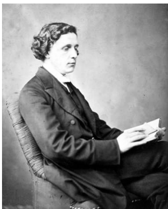
Carroll con un ejemplar de su obra más famosa.

Su primera educación la recibió de sus progenitores sin salir de casa. Cuando contaba con once años, su padre es nombrado párroco en Yorkshire, a donde se traslada la familia. Al año siguiente la nueva situación familiar le permite cursar estudios primarios en la escuela de Richmond.