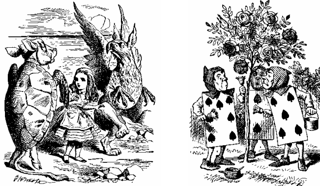
A la izquierda Alicia con la Tortuga Fingida y el Grifo. A la derecha los naipes pintando de rojo las rosas blancas que plantaron por error.

La Tortuga Fingida es una tortuga gigante y verde con una cara de vaca triste y sin cuernos. Es un animal educado y simpático al que le entusiasma que todos sepan su historia porque le gusta que todos le escuchen y que piensen que es sabio.