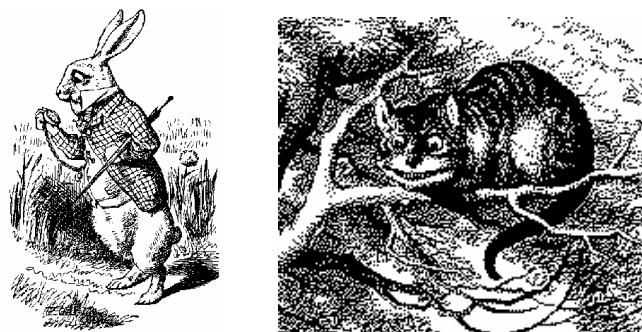
El Conejo Blanco y el Gato de Cheshire.

Como contrapunto, a esta vivaz e inquisitiva niña la acompaña el no menos vivaz, aunque inseguro, nervioso y atildado Conejo Blanco, que en el manuscrito de las aventuras subterráneas lleva además de guantes un ramo de flores. Posteriormente Carroll evocó a este nervioso animal: "Y en cuanto al Conejo Blanco, ¿fue concebido como paralelo o como contraste de Alicia? Claramente como contraste. Esto es fácil verlo si reemplazamos la juventud, la audacia y el vigor de la niña por lo mayor, tímido, débil y nerviosamente irresoluto del conejo. Me lo imagino con gafas y con una voz temblorosa, con rodillas trémulas y un porte incapaz de ahuyentar de un grito a un ganso".