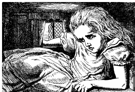
La imprudente Alicia acaba atrapada en la casa del Conejo Blanco.

Igualmente significativa es la escena en la que desmedidamente crece dentro de la casa del Conejo Blanco. ¡Qué angustia y qué asfixia siente la pobre niña condenada a vivir entre las estrechas paredes del mundo de los mayores! ¡Y qué alegría, qué liberación, cuando consigue volver al tamaño de una niña y sale corriendo hacia campo abierto! En la pradera se encuentra a otro adulto que representa la antítesis del Conejo Blanco. Si el conejo siempre tenía prisa, la Oruga se pasa la vida sentada en un hongo gigante fumando su misteriosa pipa. Es ocioso discutir si la Oruga representa o no al fumador de opio, una droga frecuente e incluso tolerada en la sociedad victoriana. En cualquier caso sí representa al adulto que pasa del mundanal ruido y que piensa que ya no queda nada por hacer.